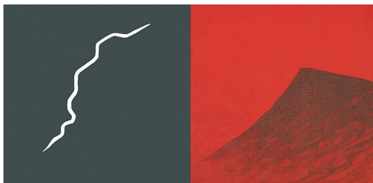
‘De rayos y montañas’. Una de las obras más conceptuales de la exposición. Acrílico/tela en 2 piezas. 67 x 134 cm. 2007.