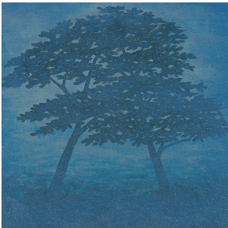
‘Abrazo de Layla’. Análisis de la luz y el tiempo en este cuadro, presente en Zaragoza. Acrílico/tela. 52 x 52 cm. 2008.

¿Qué zona urbana llevaría hoy a un cuadro pop? Es difícil... entre San Nicolás y la Seo hay unas cuantas perspectivas interesantes. También las hay en los entornos de las antiguas estaciones de Utrillas y del Norte. Incluso, en el vacío de la antigua del Portillo. Quizá esté ahora todo demasiado rediseñado pero hay muchos planos que me siguen provocando, muchos espacios a lo Chi-